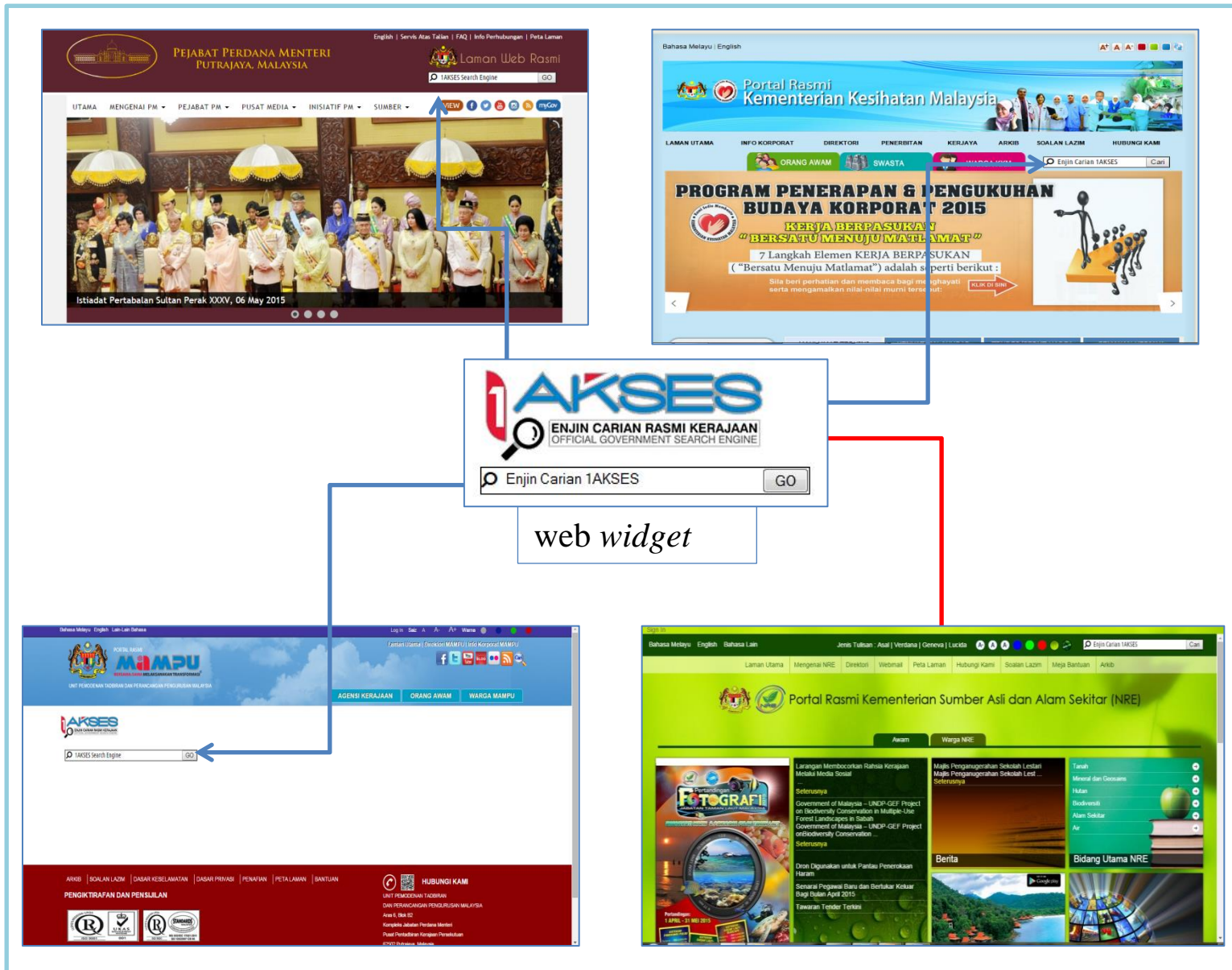
Rajah 3: Contoh Kedudukan Web Widget Pada Laman Web/Portal