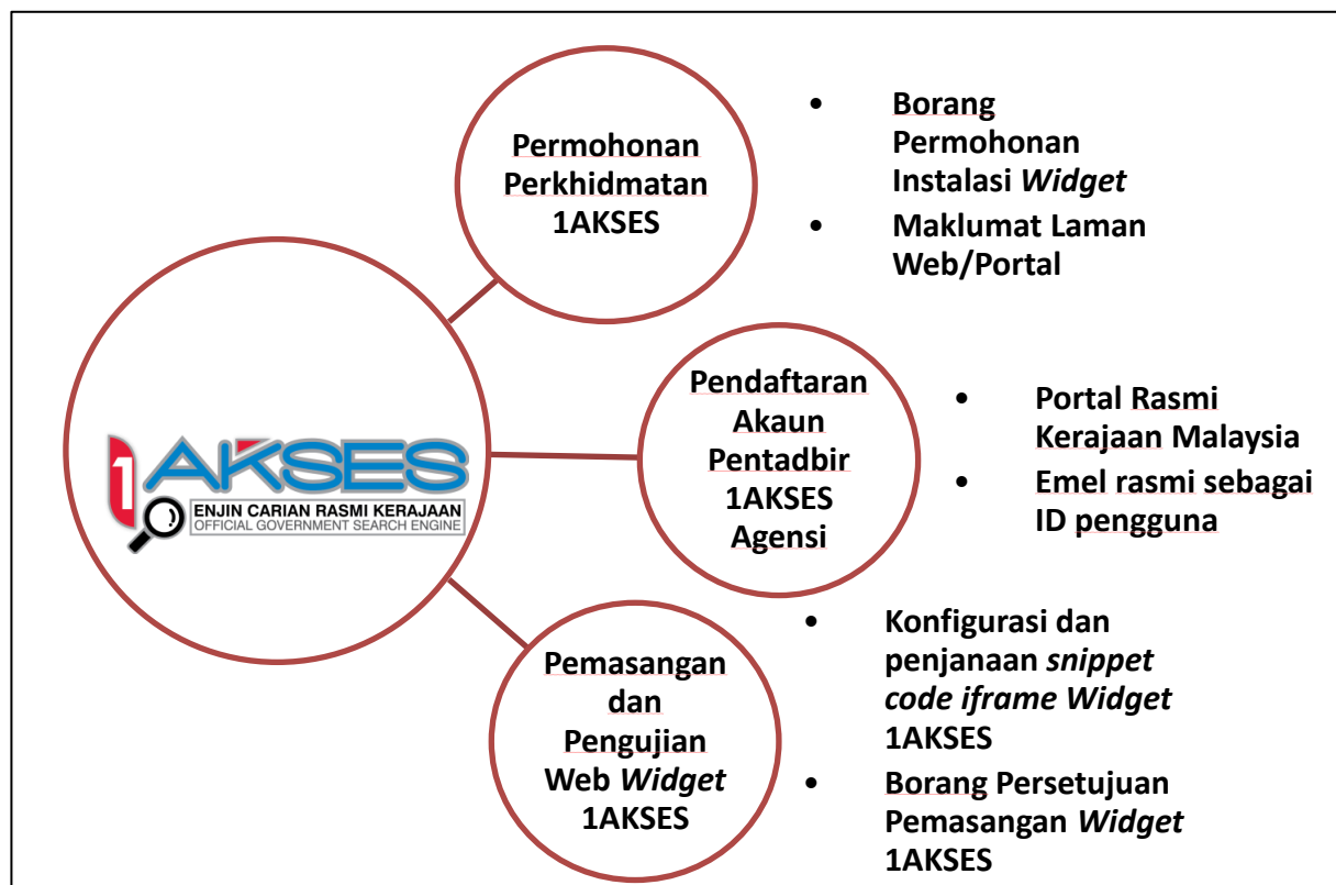
Rajah 2: Langkah-Langkah Penyediaan Perkhidmatan 1AKSES Di Laman Web/Portal Agensi