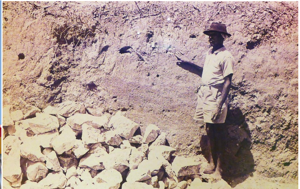
Tapak penemuan alat-alat besi bersoket di Bukit Jati, Klang