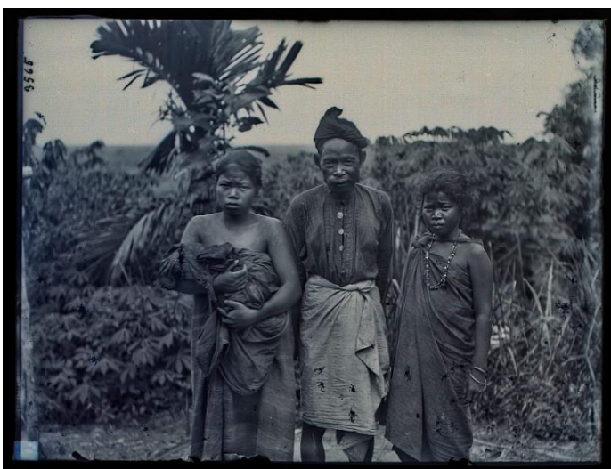
Tok Batin dan keluarga