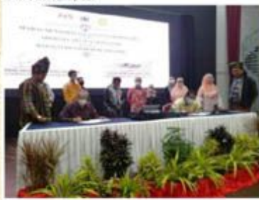
A A' KLANG - Arkib Negara dan Majlis Perbandaran Klang (MPK) menandatangani Nota Kerjasama...