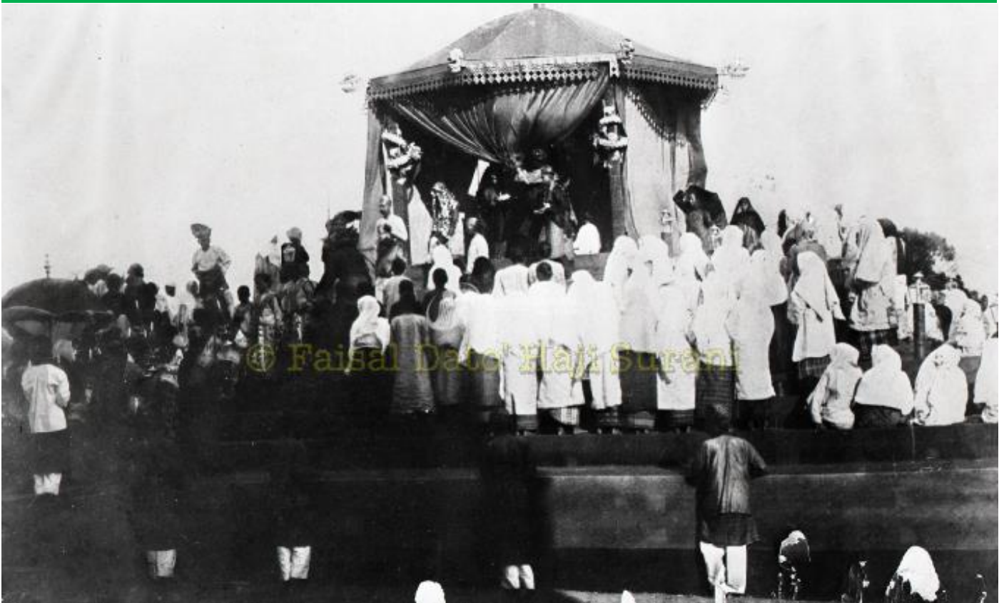
Foto di atas menunjukkan Istiadat Bersiram Tabal DYMM Sultan Ala'eddin Suleiman Shah dan Tengku Ampuan Mahrum di perkarangan Istana Mahkota Puri yang berlangsung pada hari Khamis 22 Oktober 1903. Inilah satu-satunya foto Tengku Ampuan Mahrum yang diketahui. Foto koleksi peribadi Faisal Surani. Salah satu foto yang terdapat dalam Pangkalan Data Sejarah dan Warisan di Pusat Sumber MPK.