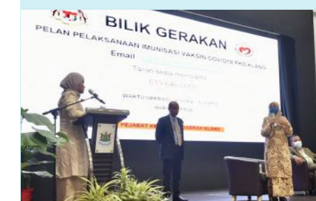
Sesi taklimat Covid-19 dan soal jawab oleh Pejabat Kesihatan Klang