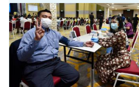
Pemeriksaan kesihatan disediakan oleh Sri Kota Medical Specialist Centre, Klang