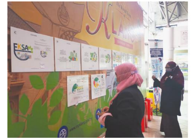
Sesi penjurian untuk memilih pemenang pertandingan merekacipta logo EKSA.