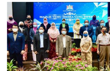
Sesi bergambar Tuan Yang Dipertua MPK, Timbalan YDP Ahli Majlis dan Ketua Jabatan MPK